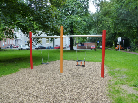
Kleinkinderschaukelsitz und Sicherheitssitz